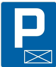
Rys. 2. ZNAK DROGOWY D-18a : parking - miejsce zastrzeżone