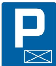
Rys. 2. ZNAK DROGOWY D-18a : parking - miejsce zastrzeżone